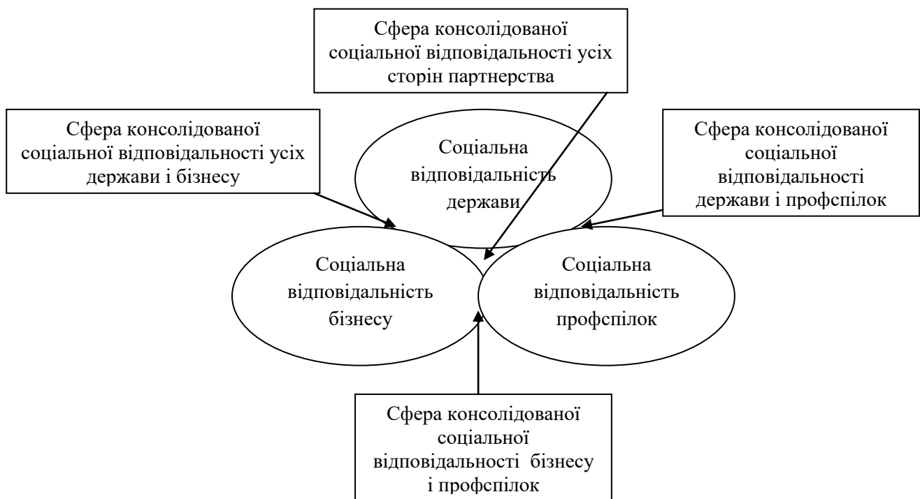
Рис. 7.1. Консолідована соціальна відповідальність соціальних партнерів у соціально-трудої сфері

Модель консолідованої відповідальності подана на рис. 7.1 [1, с. 88]