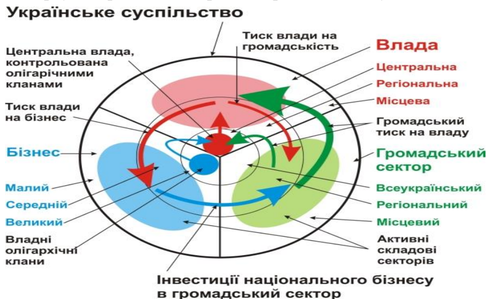
Рис. 2.1. Специфіка громадянського суспільства в Україні.

ще одна особливість становлення громадянського суспільства в сучасній Україні – першорядна роль держави та ініціювання цього процесу, як правило, революційним шляхом зверху. На рис. 2.1 відображено громадянське суспільство в Україні.