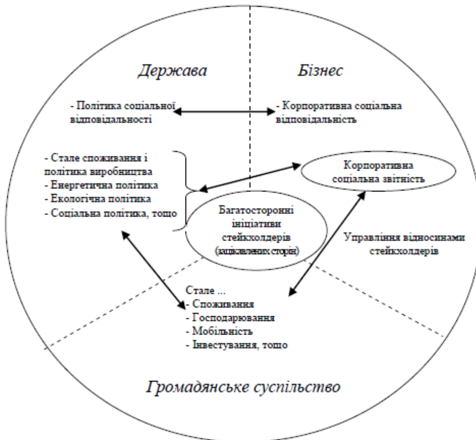
Рис. 2.3. Взаємозв'язок та взаємодія між державою, бізнесом та громадянським суспільством у контексті моделі сталого розвитку

На рис. 2.3 відображено взаємозв'язок та взаємодія між державою, бізнесом та громадянським суспільством у контексті моделі сталого розвитку [21, с. 189].