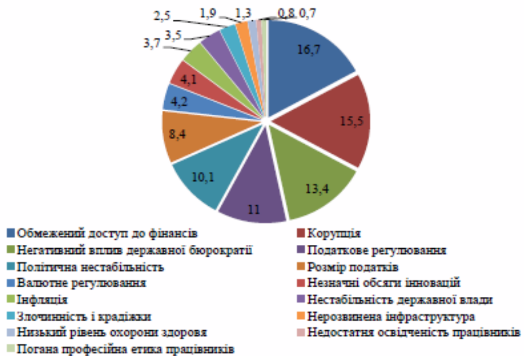
Рис 2.3..Найбільш проблемні фактори ведення бізнесу в Україні за 2013 – 2014 рр у % [26]

Як видно з рис. 2.3 найвагомішою проблемою є обмежений доступ до фінансів, що посідає перше місце та складає 16,7% від загального обсягу. Проте вдале впровадження соціальної відповідальності дає можливість подолати або зменшити прояв таких факторів як: негативний вплив державної бюрократії, злочинність і крадіжки, низький рівень охорони здоров'я, погана професійна етика працівників, корупція, розмір податків, нерозвинена інфраструктура та недостатня освіченість працівників. В сукупності названі проблемні фактори ведення бізнесу становлять 44,5% від їхньої загальної кількості. При всьому бажанні бізнесу проявляти себе у соціальній відповідальності спостерігається їх обмеженість у створенні робочих місць, наявних матеріальних цінностей та вимушеній адаптації до тиску зовнішнього середовища.