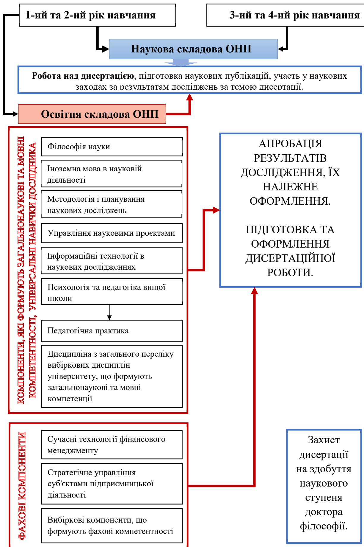
Рисунок 2.1 – Схема розподілу освітніх компонент між складовими ОНП за роками навчання